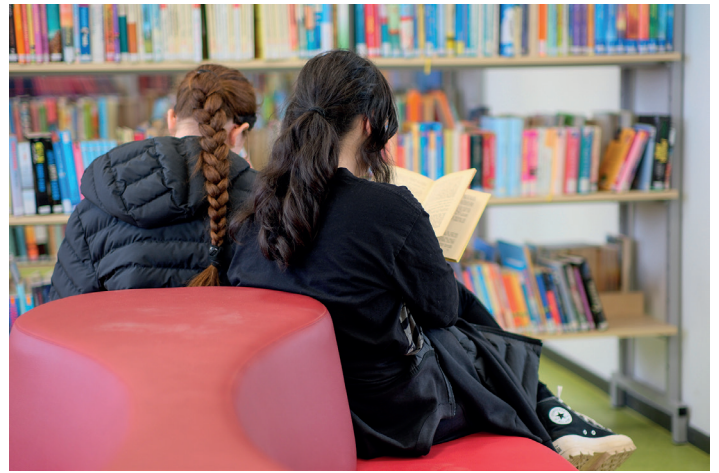
Die Bibliothek ist täglich geöffnet und kann sowohl zum Entspannen als auch für die Recherche genutzt werden.