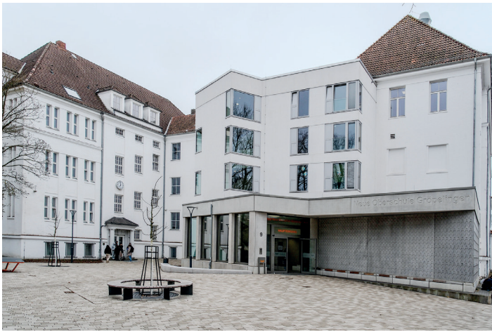
„Nur der Schulname ist in Beton gegossen, der Rest ist fluide.“ Christian Radke